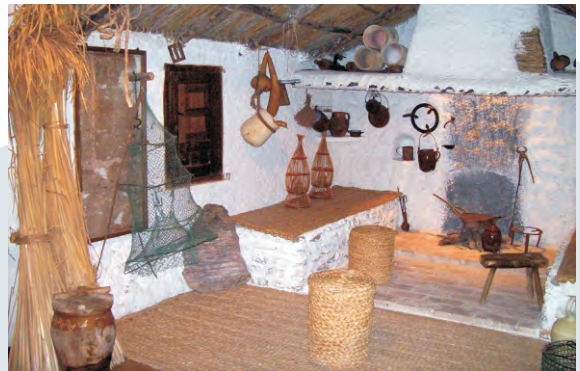
Vista interior de la Sala de Etnografía.

Todo ello, se resalta con unos contenidos interpretativos de carácter lúdico y participativo. Maquetas, paneles, dioramas, acuarios, juegos, publicaciones didácticas de apoyo, audiovisuales y otros elementos se unan con el fin de fomentar una conciencia social que valore el recurso agua, incrementando la sensibilización de los habitantes de la región sobre la problemática del agua y la interacción y dependencia económica que tienen con este bien, tan limitado como imprescindible.