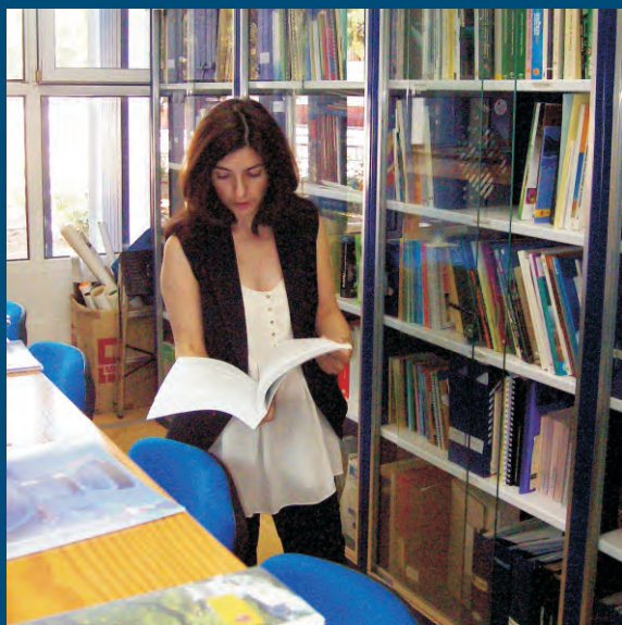
Vista del Centro de Documentación

El Centro del Agua promueve la Educación Ambiental en todos los sectores de la sociedad además de ser un recurso de intercambio cultural y científico sobre el medio natural. Para ello se creó un Centro de Documentación especializado en temas relacionados con el Agua y los Humedales que actualmente cuenta con más de dos mil volúmenes, incluyendo aproximadamente 50 colecciones de publicaciones periódicas, una videoteca, una cartoteca y un Banco de Imagen, con más de 250 imágenes, que conserva documentación histórica sobre los humedales manchegos desde comienzos del siglo XX.