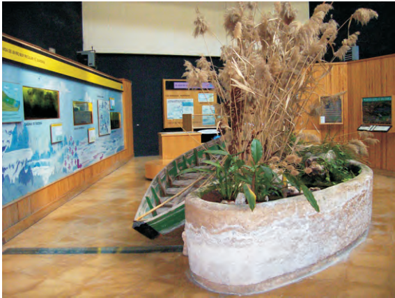
Vista interior de la Sala de Interpretación