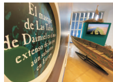
Centro del Agua - Savia