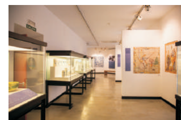
Museo Comarcal de Daimiel