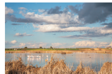
Laguna de Navaseca