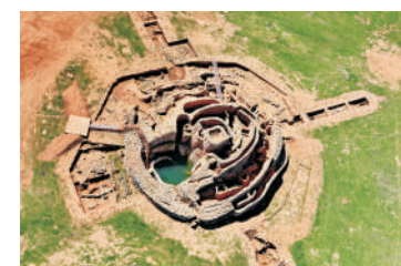
Motilla del Azuer