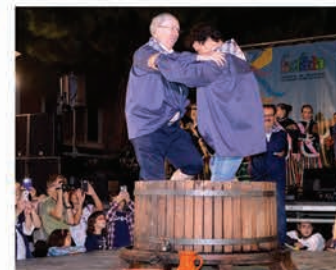
Fiesta de la Vendimia

Coincidiendo con el término de la vendimia, son numerosos los actos programados para difundir y promocionar las tradiciones de la cultura del vino en Daimiel.