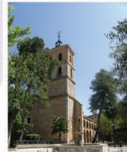
Iglesia de Santa María

De finales del siglo XIV, este edificio gótico se asoma a los jardines del Parterre por su puerta renacentista. La fachada Norte del templo es la que conserva los más claros vestigios del gótico, con elevados contrafuertes terminados en agujas con decoración de bolas.