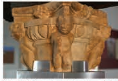
Capitel, Casa de los Carrillo, s. XVI (Museo Comarcal)