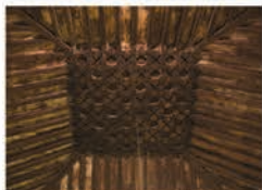
Artesonado (Ermita de San Roque)

Fue construida en la segunda mitad del siglo XVI. Es de pequeñas dimensiones y en ella sobresale el artesonado mudéjar de formas geométricas sobre el altar mayor.