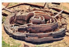
Motilla del Azuer (2200-1350 a.C.)

Actualmente Daimiel, en pleno corazón de La Mancha, es una ciudad en constante evolución poseedora de una gran riqueza natural, histórica, patrimonial, cultural y de ocio que la convierten en destino turístico imprescindible.