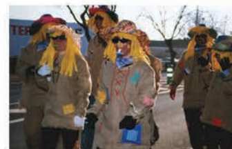
Día del Río (Carnaval)

Es la fiesta pagana por excelencia remontando sus orígenes al siglo XVII.