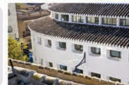
Mercado de abastos (Miguel Fisac)

Construido a mediados del siglo XX y de aspecto típicamente manchego, el arquitecto Miguel Fisac se inspira en las antiguas quinterías manchegas para diseñar este imponente edificio.