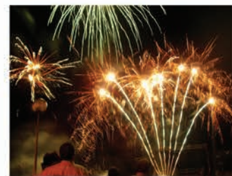
Feria y Fiestas

Música, actividades deportivas, culturales, gastronómicas..., en honor a la Virgen de las Cruces, patrona de Daimiel.