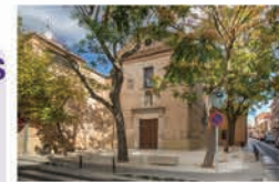
Iglesia de Las Mínimas

Construida en las últimas décadas del siglo XVII, sigue el estilo de la arquitectura conventual del momento. Se encuentra aneja al convento de las monjas Mínimas de San Francisco de Paula.