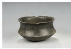
Vaso Carenado (Museo Comarcal)