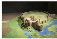
Maqueta de Calatrava La Vieja (Museo Comarcal)