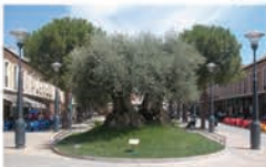
Olivo Milenario (Plaza de España)

En uno de los extremos de la plaza se localiza este magnífico monumento natural que, según cuenta la tradición, fue plantado por los musulmanes alrededor del año 900.