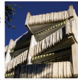
Edificio del Parterre (Miguel Fisac)

Para la edificación de este singular edificio Miguel Fisac empleó una de sus patentes más conocidas, el hormigón flexible, de ahí el aspecto acolchado en los balcones.