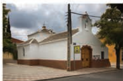
Ermita de San Isidro

Data del siglo XVII y era conocida como ermita del "Ecce Homo". Responde al canon de arquitectura religiosa tradicional de la zona.