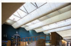
Cubierta del área interpretativa (Centro del Agua)

Miguel Fisac diseñó este edificio en los años cincuenta, convirtiéndose en uno de los referentes de la arquitectura española del siglo XX. Es el punto de partida para contextualizar los orígenes de las Tablas de Daimiel, la Laguna de Navaseca y la Motilla del Azuer.