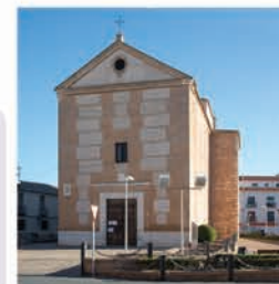
Iglesia de La Paz

Se exponen los pasos y atributos de la cofradía del mismo nombre que desfila en la Semana Santa de Daimiel, declarada Fiesta de Interés Turístico Regional.