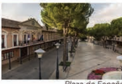
Plaza de España

Plaza de trazado popular manchego originaria del siglo XVI. Se encuentra flanqueada por soportales. Es el principal punto de encuentro y celebración de la ciudad.