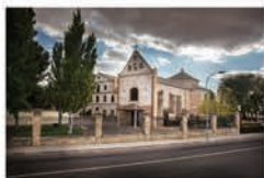
Ermita del Cristo de La Luz

De mediados del siglo XVIII, su interior se define como una ermita de planta de cruz latina con bóveda de cañón y cúpula cubriendo el crucero.