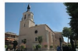
Iglesia de San Pedro

De estilo gótico tardío, su construcción se debe al incremento que experimentó la población de Daimiel en el siglo XVI. Destaca la puerta situada a los pies de la nave de estilo renacentista.